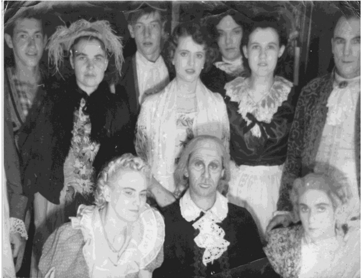
Představení Lakomec z roku 1953