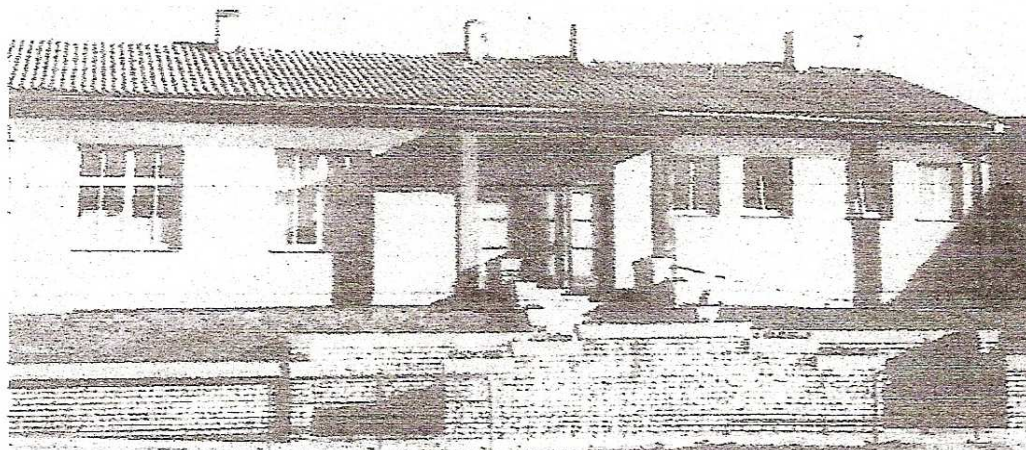
Mateřská škola v roce 1959