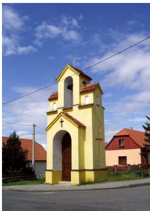
Kaplička v Libečově byla postavena roku 1887

Libečov se připomíná v listině vydané králem Přemyslem Otakarem I. Pro jeho sestru Anežku, abatyši kláštera benediktinek při bazilice sv. Jiří na Pražském hradě. Listina potvrzuje držení statků a majetku klášterem. Vedle řady vsí se jmenuje i Libečov.